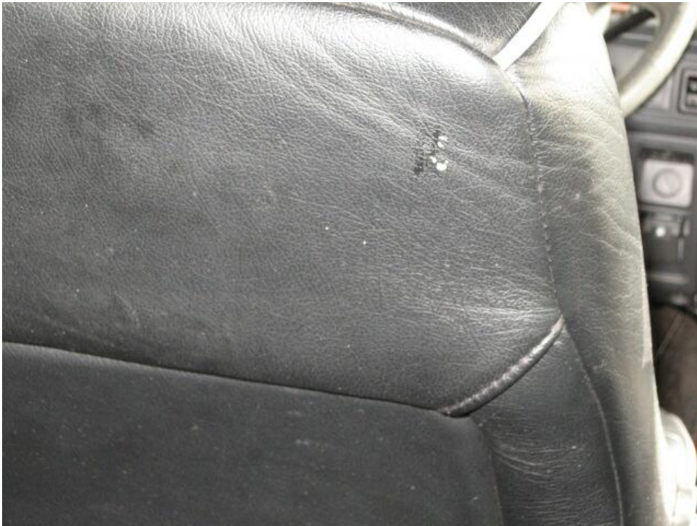
Bild:13 Gebrauchsspuren an den Sitzbezügen