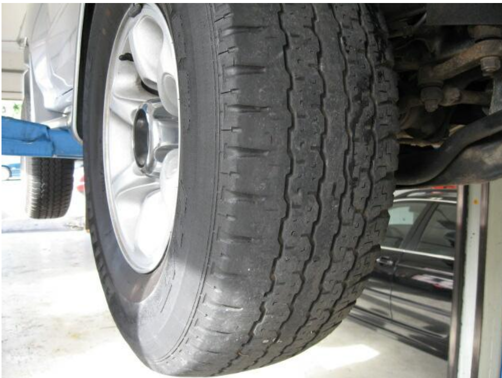
Bild:22 Reifen vorne im Schulterbereich stark verschlissen