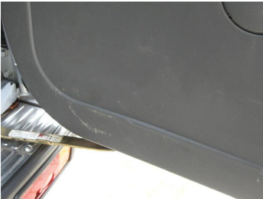
Bild:14 Türverkleidung r. verschrammt