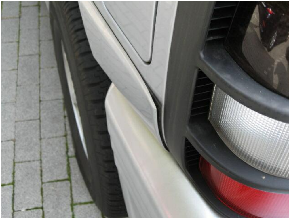
Bild:15 Zierleiste hl lose