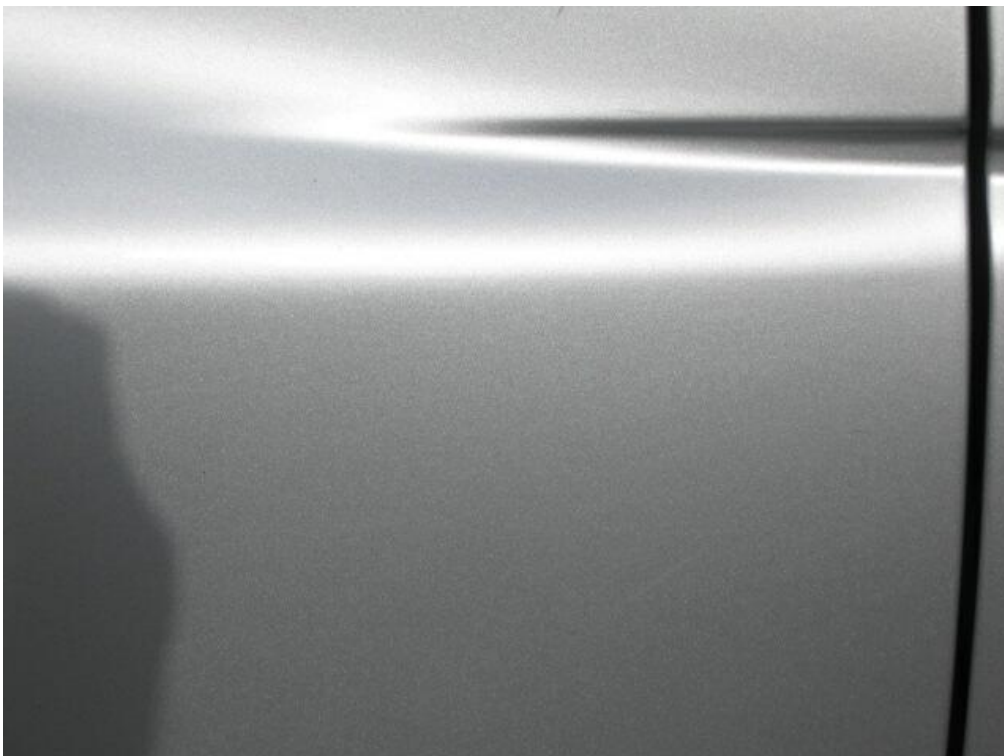
Bild:16 Seitenwand h r leicht verschrammt