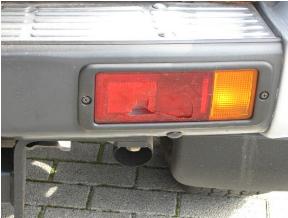
Bild:17 Schlußleuchtenglas rechts beschädigt