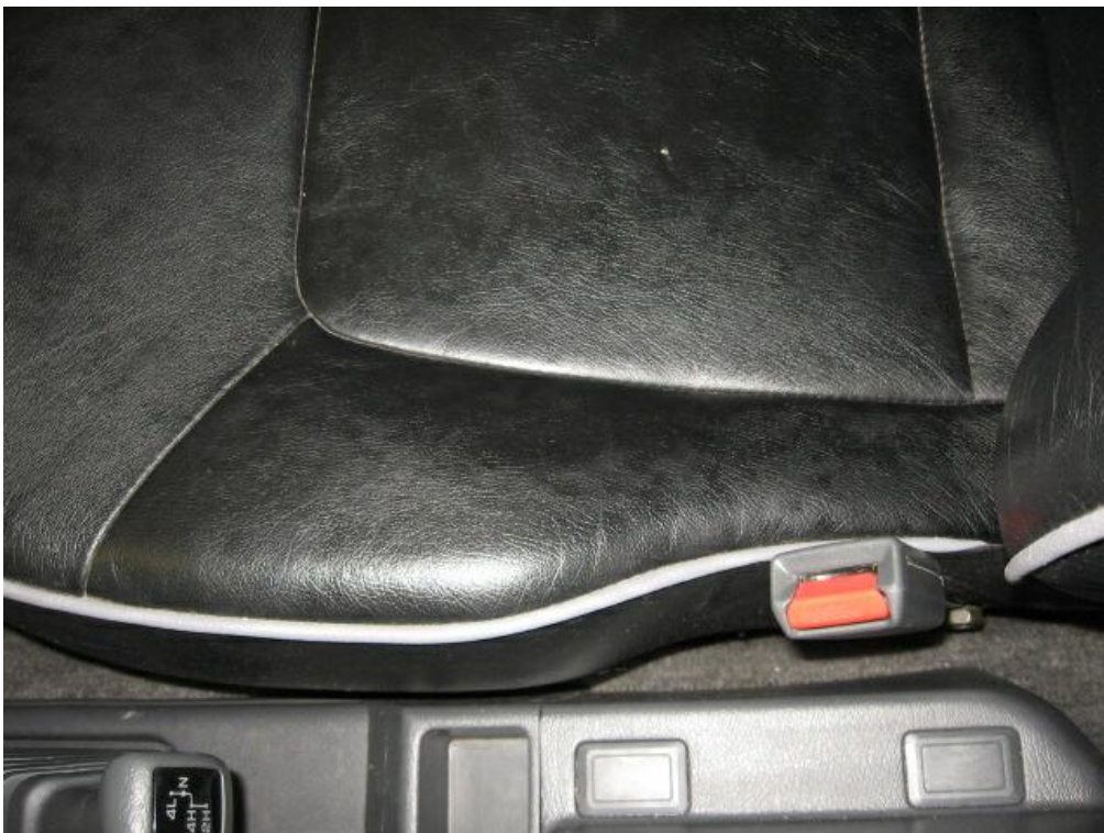
Bild:32 leichte Gebrauchsspuren an den Sitzbezügen