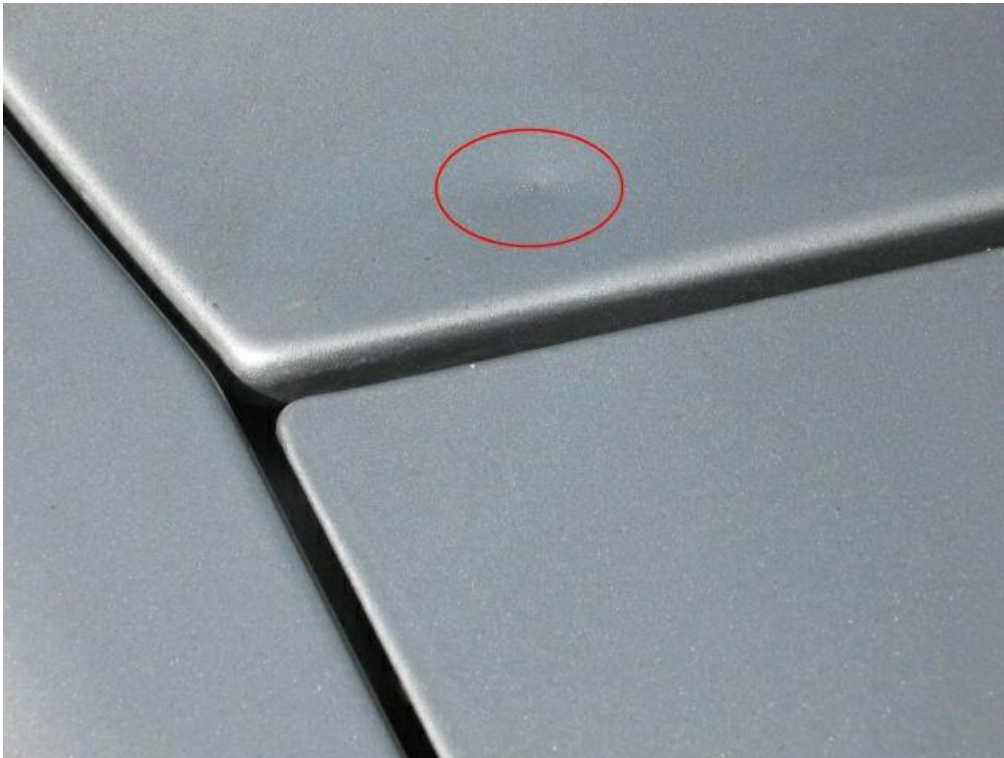
Bild:9 Kleine Delle im Windlauf rechts