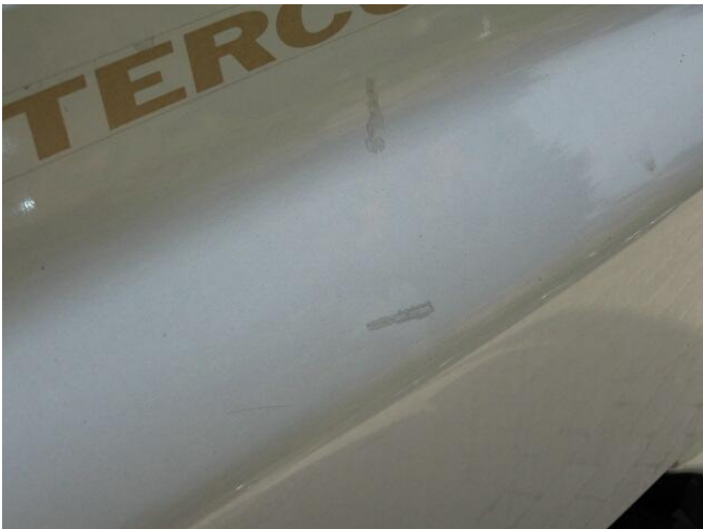
Bild:18 Seitenwand links verschrammt