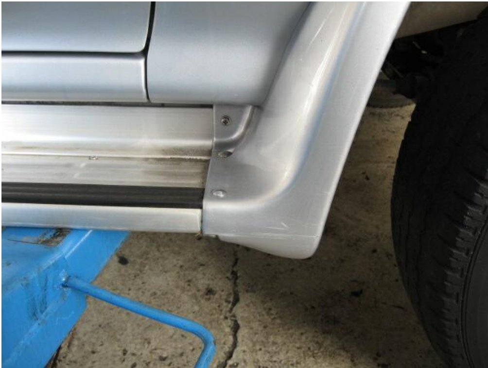
Bild:31 Radlaufverkleidung vr verschrammt