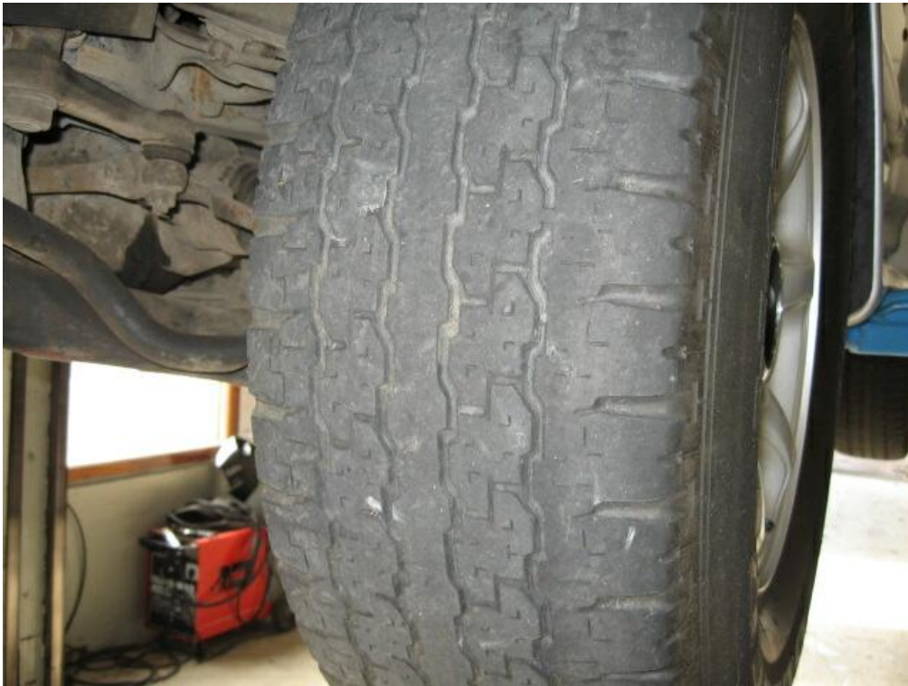
Bild:21 Reifen vorne im Schulterbereich stark verschlissen