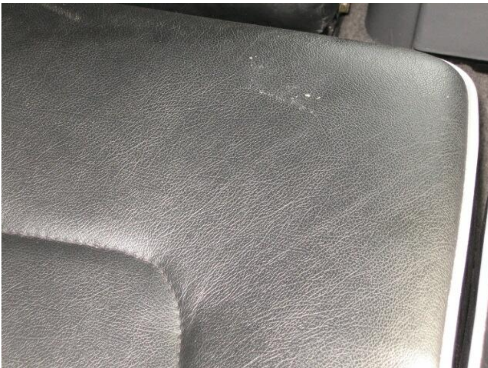
Bild:12 leichte Gebrauchsspuren an den Sitzbezügen