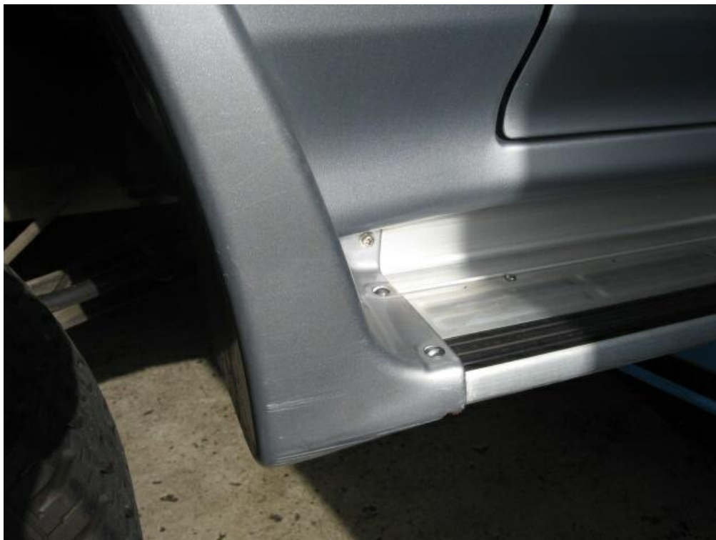
Bild:30 Radlaufverkleidung hr verschrammt