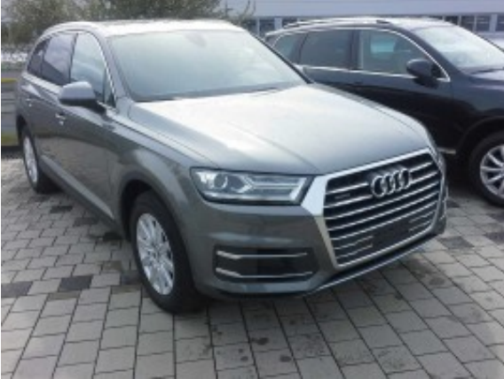
Abbildung 1: Schräg vorne