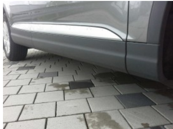
Abbildung 16: Schweller