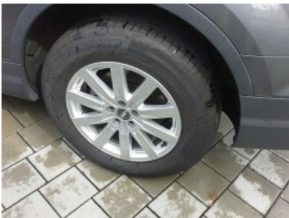
Abbildung 11: Räder/Reifen