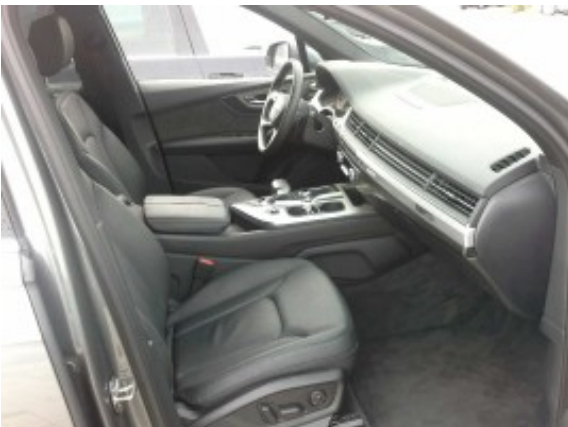
Abbildung 5: Innenraum