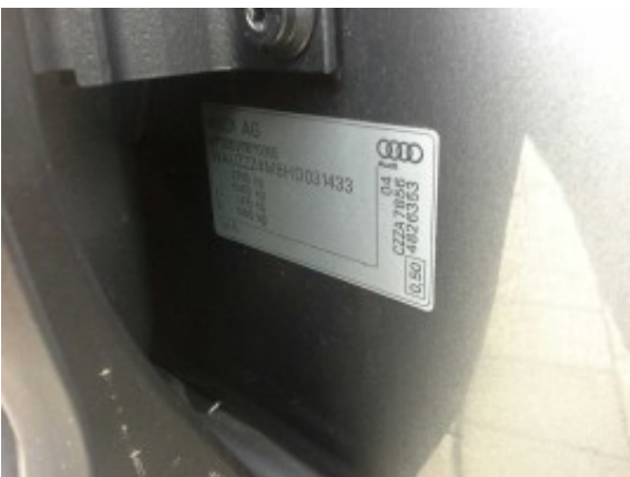
Abbildung 17: FIN / Typenschild