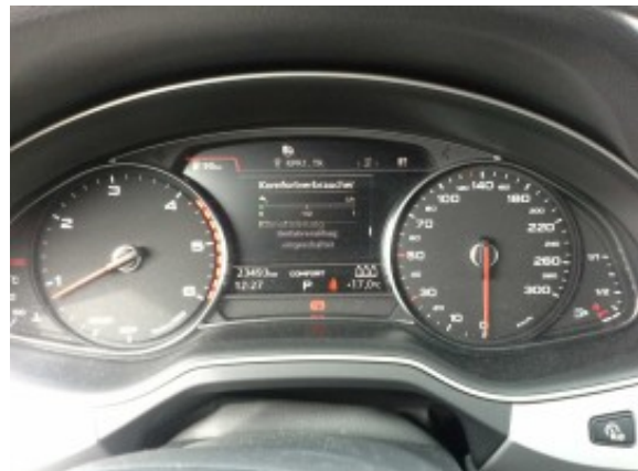
Abbildung 6: Innenraum