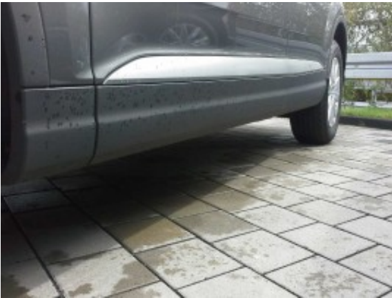
Abbildung 15: Schweller