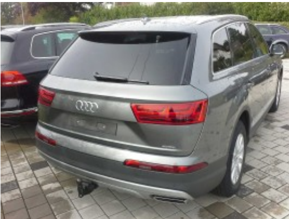
Abbildung 3: Schräg hinten