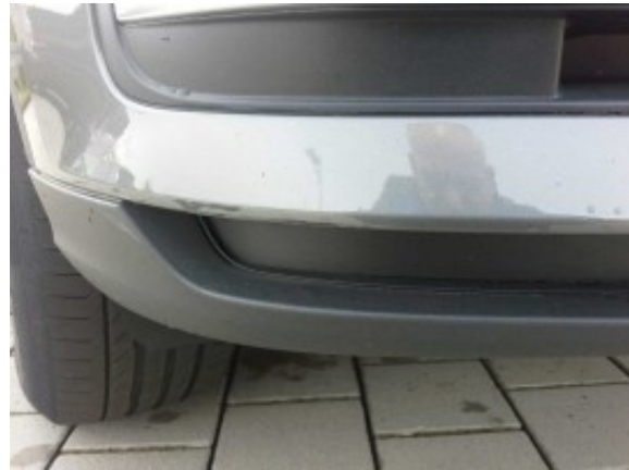
Beschädigung 1: Stossfänger vorn: Stossfänger vorn - verkratzt / verschürft - instandsetzen und lackieren