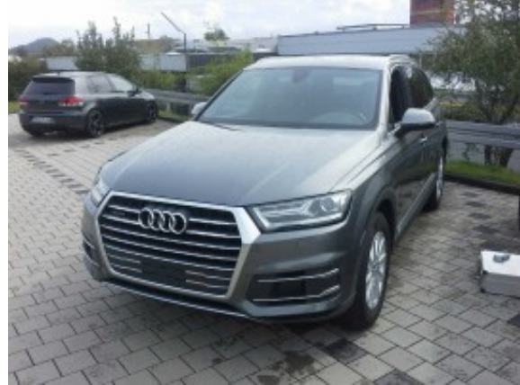
Abbildung 2: Schräg vorne