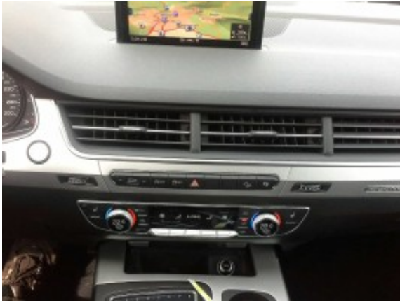
Abbildung 9: Sonstiges

Bei Ruckfragen bitte Gutachtennummer und Datum angeben