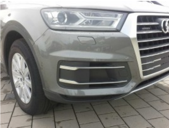
Beschädigung 1: Stossfänger vorn: Stossfänger vorn - verkratzt / verschürft - instandsetzen und lackieren