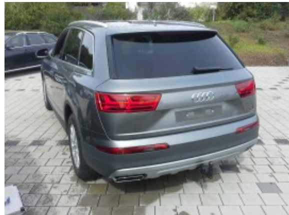
Abbildung 4: Schräg hinten