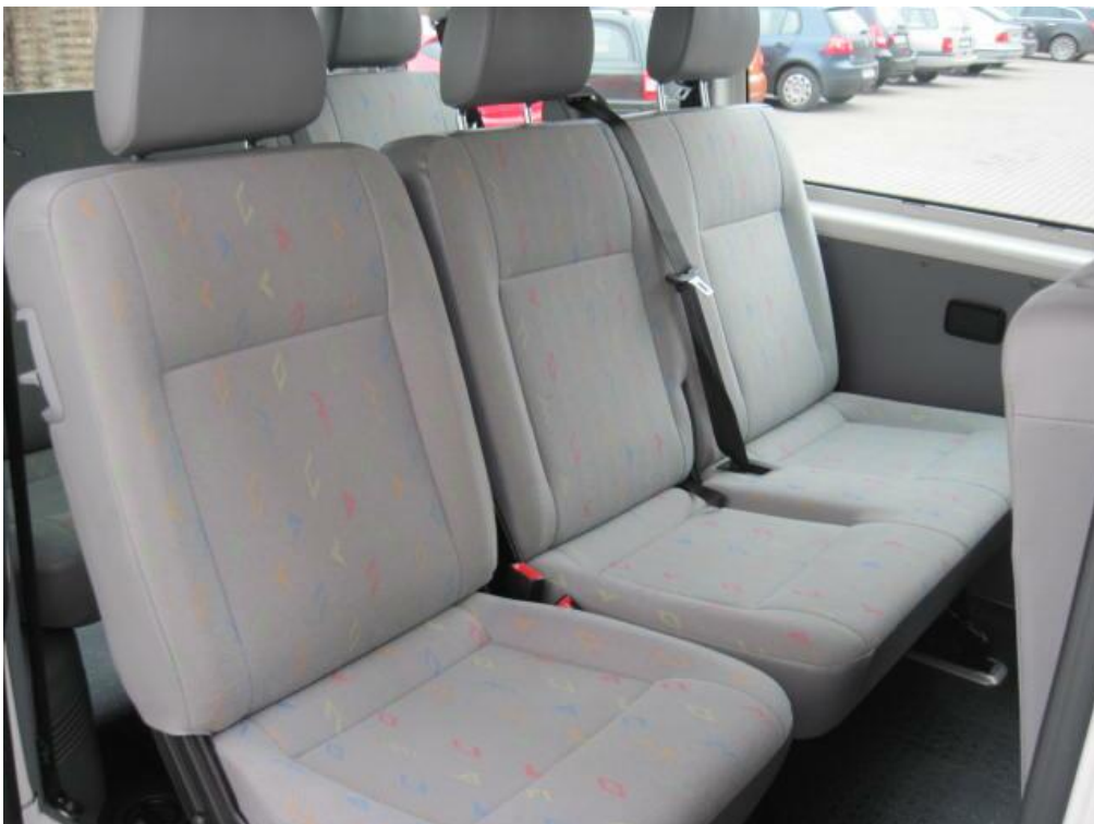
Bild:12 1. Sitzreihe hinten