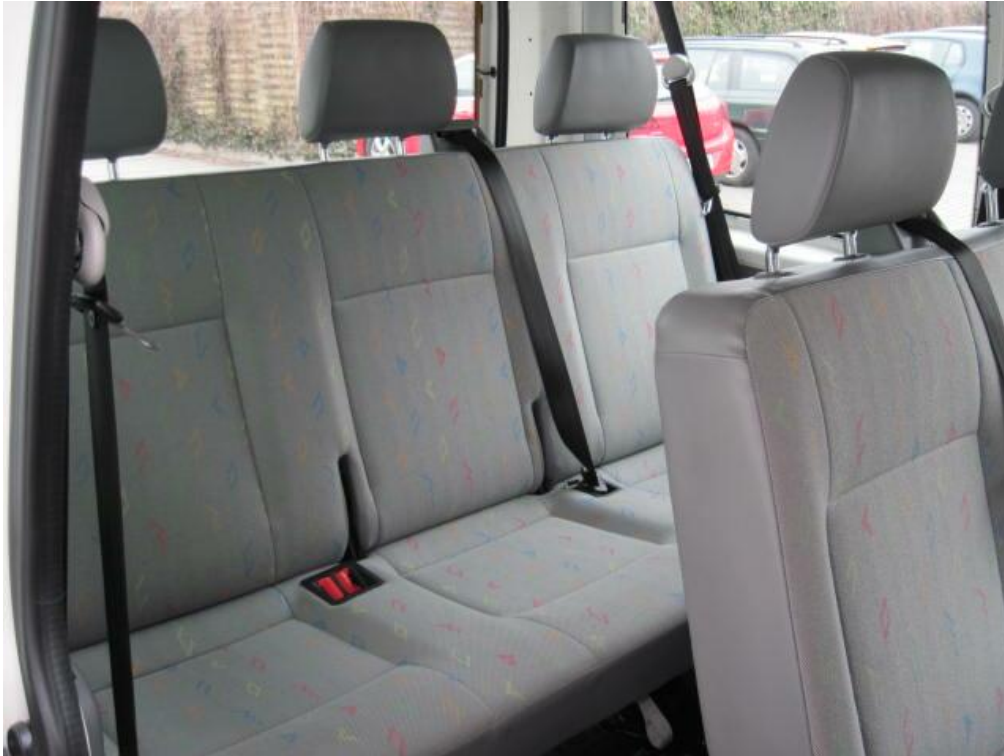
Bild:11 2. Sitzreihe hinten