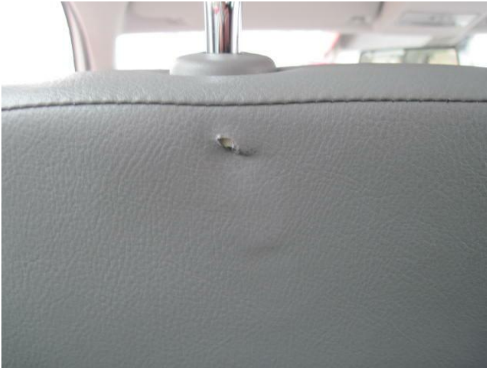
Bild:13 Fahrersitzlehnenbezug an Rückseite eingerissen