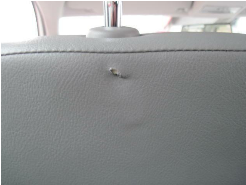
Bild:13 Fahrersitzlehnenbezug an Rückseite eingerissen